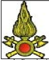
Comando Provinciale Vigili del Fuoco Verona